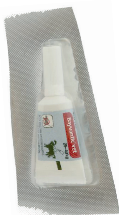
Vaikuttava aine imeytyy verenkiertoon ja punkin tulee purra koira, jotta se kuolee.

Yhtä poikkeusta lukuun ottamatta valeluliuosten toimintaperiaate on pääpiirteittäin sama. Lääkeaine sitoutuu ihoon ja karvoihin, ja punkki kuolee ollessaan kontaktissa niihin. Tällä tavoin toimivien valmisteiden vaikutusaika on 4 viikkoa. Fluralaneeri (kauppanimi Bravecto paikallisvaleyliuoste) tekee tähän poikkeuksen. Kyseisen valmisteen vaikuttava aine imeytyy verenkiertoon ja punkin tulee purra koira, jotta se kuolee. Tämän lääkkeen vaikutusaika on 12 viikkoa.